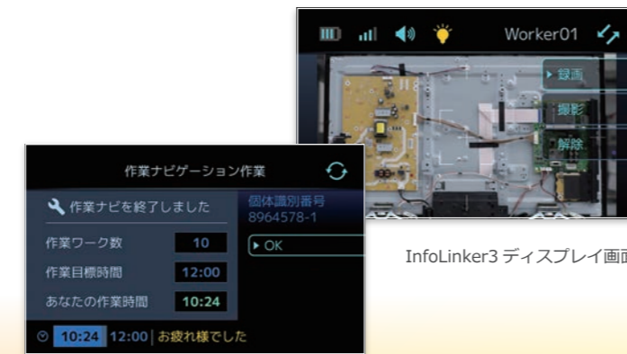
InfoLinker3 ディスプレイ画面