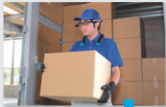
（現場作業者） （非熟練者）