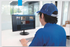
（事務所側） （指示者・熟練者）