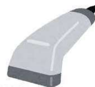
1次元バーコード リーダー