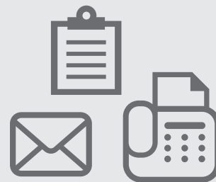
在庫が減ったら自動で発注 またはメール等でお知らせ