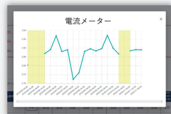
点検結果をグラフで可視化