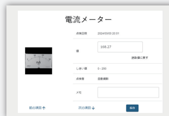
エビデンスを画像で確認可能

Web 管理画面では数値だけでなくメーター画像も確認できる。点検データ推移をグラフ表示して活用可能。